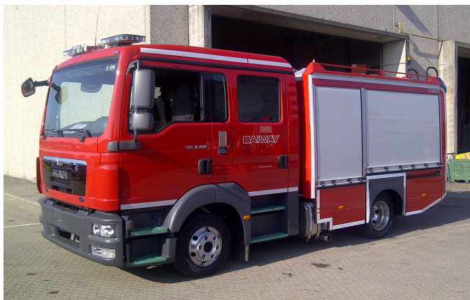
Das Bild zeigt eine mögliche Fahrzeugausstattung und ist nicht bindend.

Fahrgestell: MAN TGL 8.180 Antrieb: 4x2 Kabine: Originalkabine MAN, Staffelbesatzung Auslieferung: August 2013 Stückzahl: 1 Fahrzeug