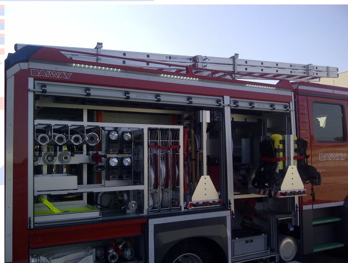
Das Bild zeigt eine mögliche Fahrzeugausstattung und ist nicht bindend.

Heckwarnpaneel: zur rückwärtigen Fahrzeugabsicherung, drei synchron blinkende LED-Felder